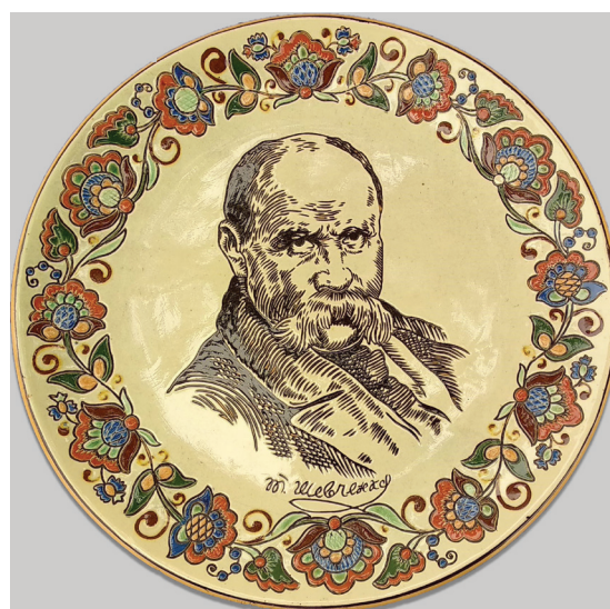
Рис. 7. Блюдо з портретом Т. Шевченка, автор Н. Протор'єва, 1959 р., майоліка

15. ПХІМ-3763 КН-2013. Блюдо з портретом Т.Г. Шевченка, автор – Н. Протор'єва, 1951 р. Васильківський майоліковий завод, майоліка, d-30 см. Придбана у 1959 р. за 45 крб. [4; 3].