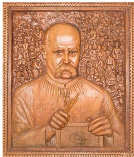
Рис. 8. Пласт декоративний «Т.Г. Шевченко», автор В. Завгородній, 1991 р., дерево

10. М-3371 КН-41299. Пласт декоративний «Т.Г. Шевченко», автор – В.Л. Завгородній, майстер народної творчості, 90x106 см. Дерево, різьба, ручна робота, передано автором у 2008 р. Нині знаходиться в експозиції зали № 8 Музею Заповіту Т.Г. Шевченка [3; 6].