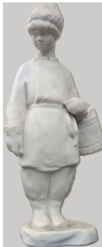
Рис. 4. Скульптура «Мені тринадцятий минало...», автор В. Щербина, 1961 р., порцеляна

20. К-2172 КН-22515. Скульптура «Мені тринадцятий минало...», автор – В.І. Щербина, м. Київ, 1961 р., заслужений художник України. Скульптурка біла, на товстій підставці із зображенням хлопчика-підлітка у свитині, рукавицях, постолах, із дерев'яним відром у лівій руці та нахиленою набік головою в шапці, 30,7x10,2 см, порцеляна, бісквіт, придбана у автора за 150 крб. у 1988 р. [2; 4].