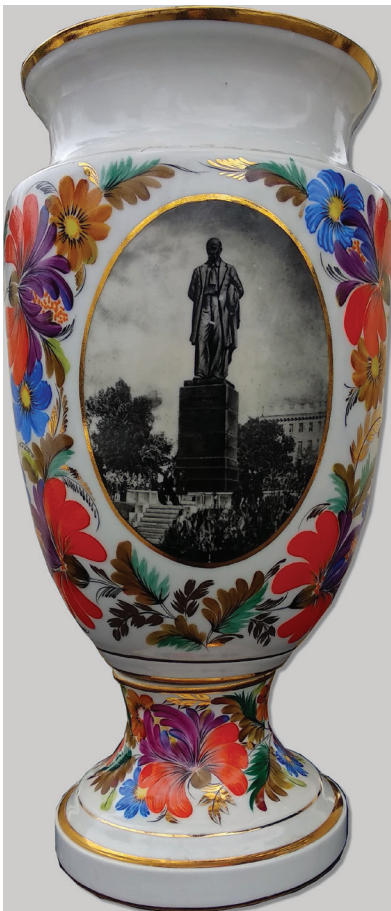
Рис. 5. Ваза із зображенням пам'ятника Т. Шевченку, автор невідомий, 1954 р., порцеляна

3. ПХІМ-2654 КН-428. Ваза з портретом Т.Г. Шевченка, автор невідомий, білого кольору, 20x7,5 см, креолінове скло. Придбана за 17 крб.